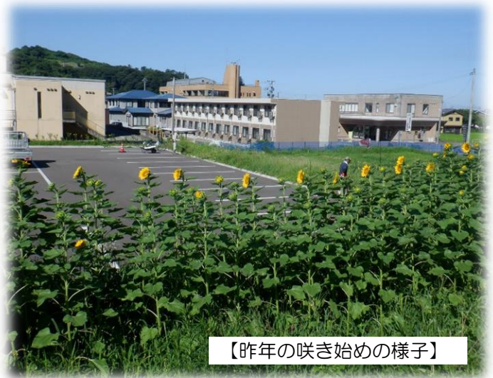
【昨年の咲き始めの様子】

また、草刈り作業終了後、毎年実施している椿寿苑駐車場空き地につくし工房の「つくしひまわりにっこりプロジェクト」に協力するためのヒマワリの種まきを行いました。生育はまだですが、真夏には大輪の花を咲かせてほしいです。皆さんも花が咲きましたら、ぜひご覧ください。