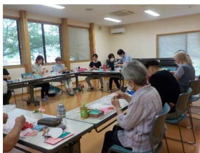
ほっとタイム(桃園) フェルトのバラ作り