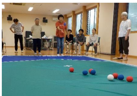
あけぼの健康づくりの集い 「ポッチャ」の体験